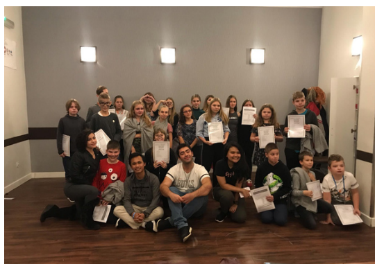
Każdy z uczestników otrzyma Certyfikat potwierdzający ukończenie szkolenia „EuroWeek – Szkoła Liderów”

W trakcie trwania szkolenia wszyscy uczestnicy będą mieli szansę zapoznać się z zasadami projektów Wolontariatu Europejskiego, projektów dotyczących Ameryki Południowej, Środkowej, Afryki, Azji, jak również międzynarodowych wymian młodzieży. Ponadto każdy uczestnik szkolenia będzie miał możliwość prowadzenia konwersacji w języku angielskim oraz poznania muzyki i nauki tańców narodowych z krajów wolontariuszy goszczonych przez Fundację EuroWeek. Po zakończeniu obozu Fundacja EuroWeek będzie przysyłać wszystkim zainteresowanym aktualne informacje na temat projektów i wymian młodzieży.